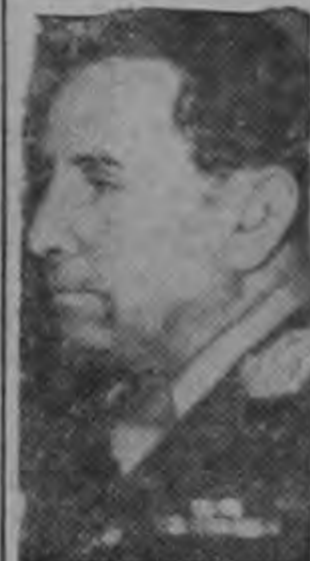
Manuel Odría Peru

mulgado la ley agraria que reivindicaba los derechos del hombre a la tierra. ¿Casualidad? No. Premeditación y alevosía. Don Rómulo va resultaba demasiado peligroso para los factores contrarios al progreso venezolano. Prometió a su pueblo levantarlo de la esclavitud feudal y le dió la Ley de Reforma Agraria. Se empeñó en elevar el nivel intelectual de su país y san-