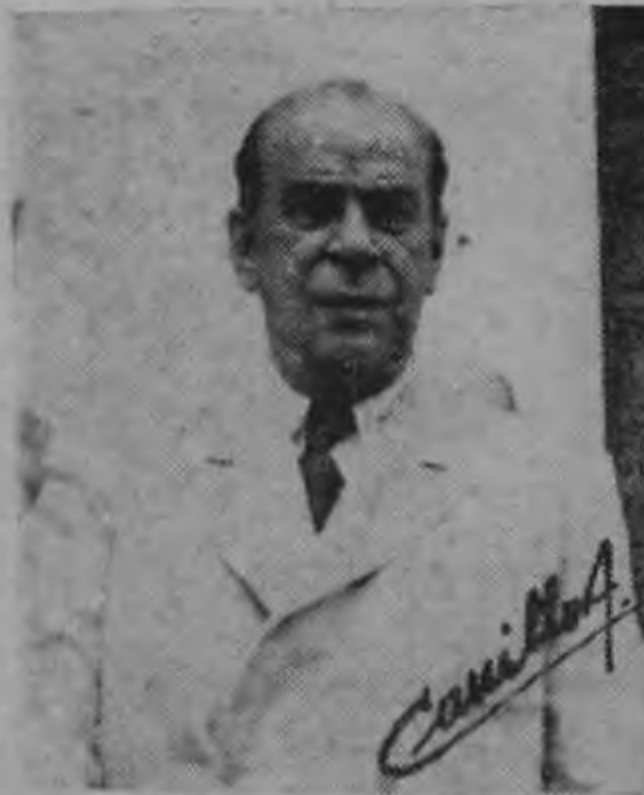
ROMULO GALLEGOS ...cayó al mes escaso de haber promulgado la ley agraria...

A las fuerzas armadas que gozan con influencia decisiva en el destino de sus pueblos, les este que la ley esté por encima del todo. Y las fuerzas armadas buscan al dictador para que les tal, que sólo le preocupa lue-