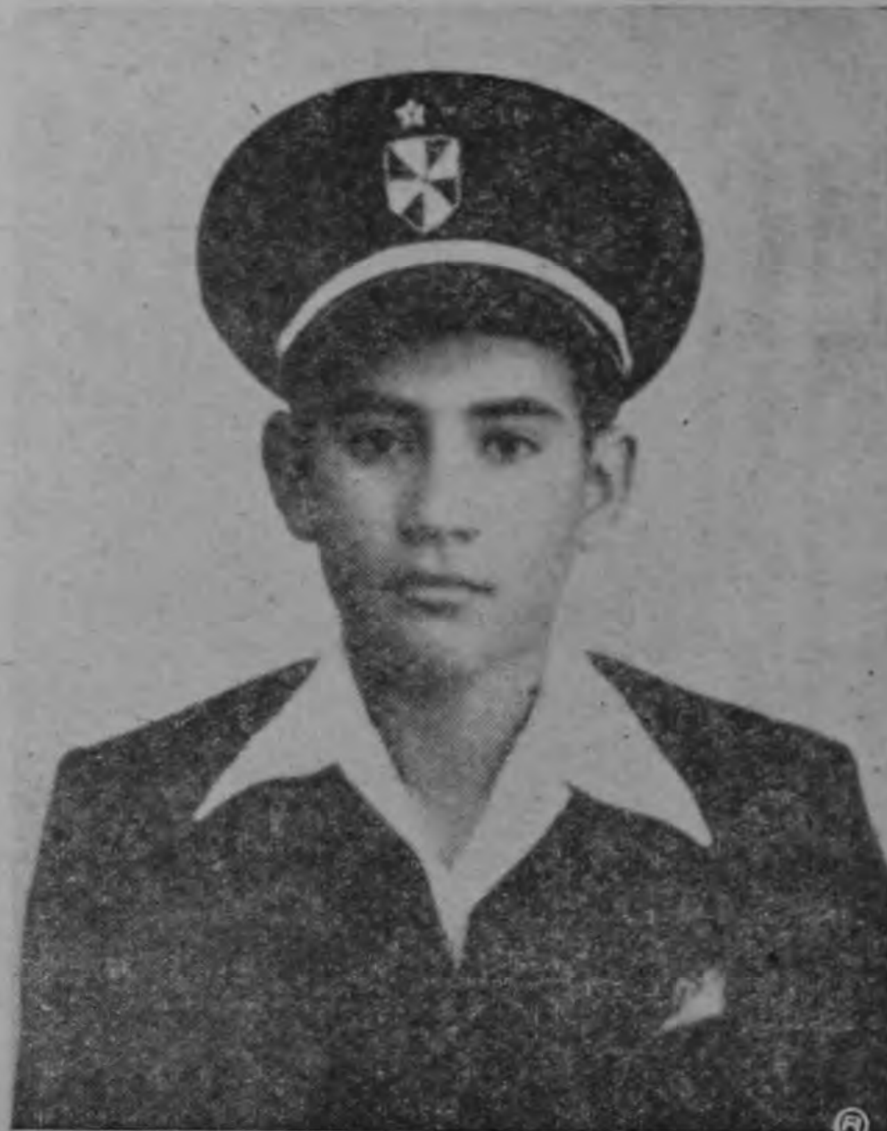
DON RODRIGO CHAVES CASAS