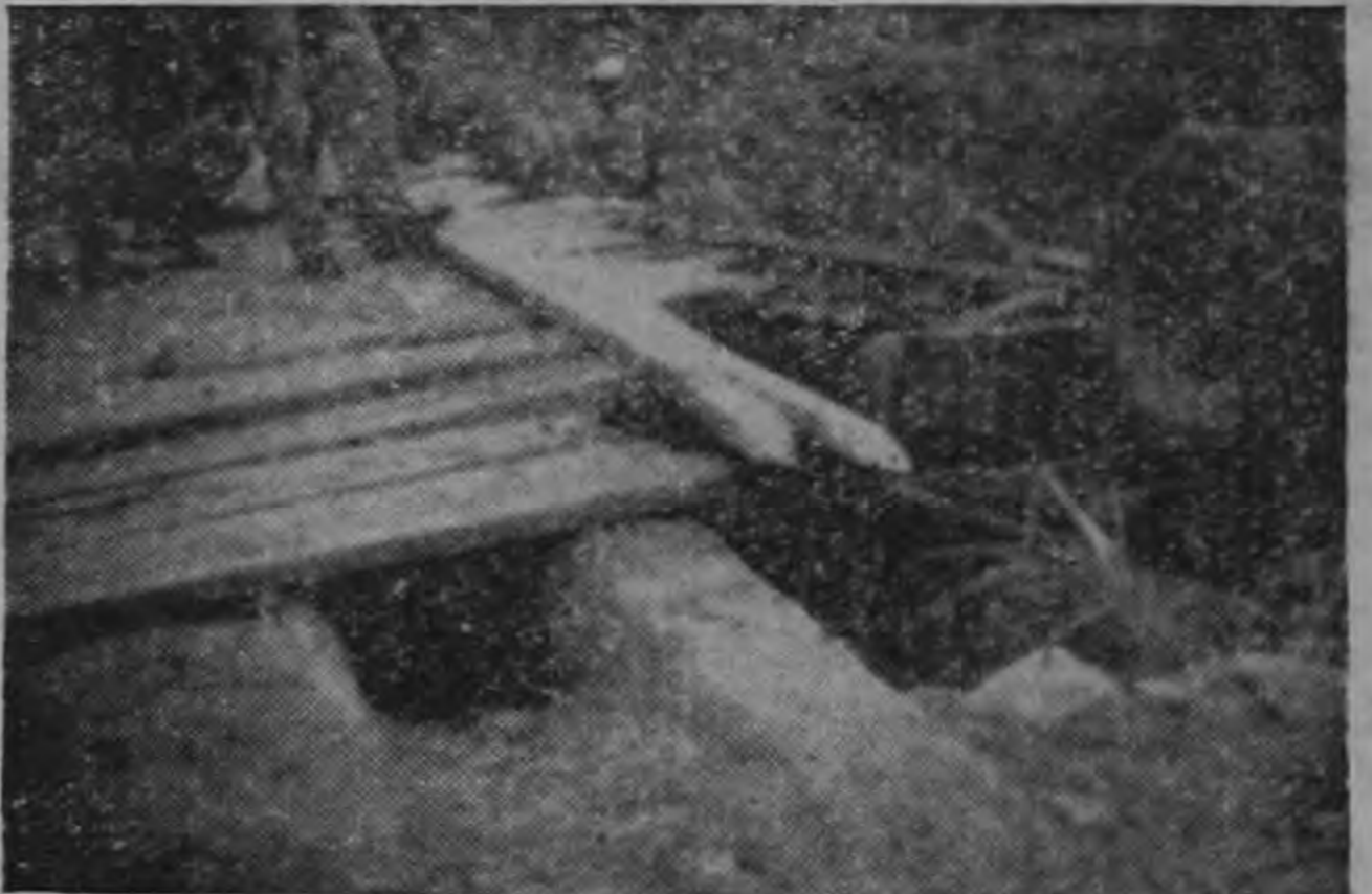
VOLCONAZO.—Dos gráficas del accidente en la carretera Pangua-San Isidro. Véase la forma en que quedó el camión, con las ruedas hacia arriba y el puente que causó el accidente, que no dejó saldos lamentables por obra de milagro.