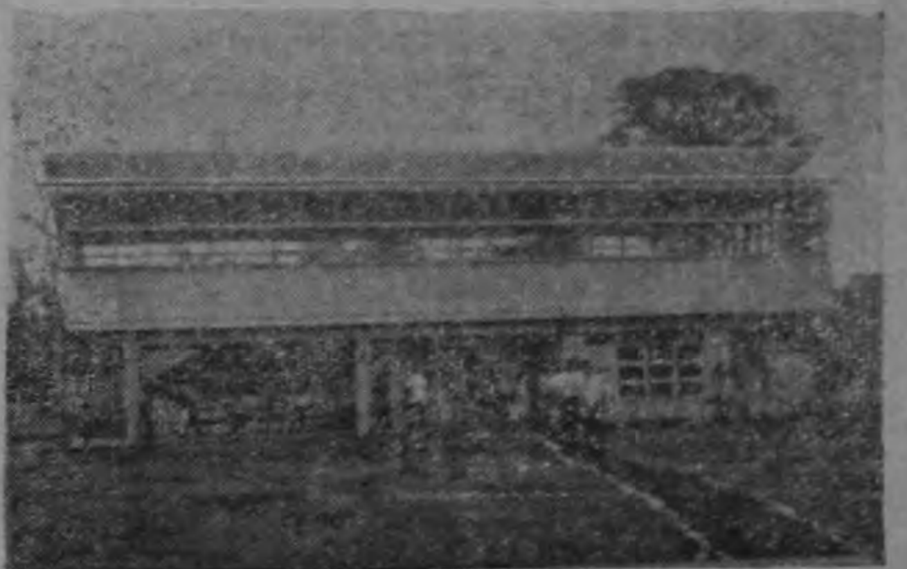
UNA ESCUELA RURAL MODELO.— La foto reproduce una vista de la Escuela de 28 Millas, entregada por el MOP a principios del presente mes. La escuela de 28 Millas puede bien considerarse como un modelo de escuela rural. Su dotación es mucho más amplia que las escuelas usuales y en ella se han puesto en práctica varios principios funcionales de la técnica moderna. Por ejemplo: tiene su planta eléctrica propia, de manera que dispone de luz, a pesar de no haber corriente en la localidad; tiene un espacio para juegos y recreos debidamente techado, de forma que, en una región lluviosa como la atlántica, los chicos tienen como hacer sus recreos en todo tiempo; la casa del maestro le está incorporada por lo cual es posible su constante presencia en la escuela, y se evita la necesidad de los viajes diarios que pueden ocasionar retrasos en las clases; tiene su cañería propia que la abastece ampliamente de agua, ya que no hay cañería local. En virtud de estas condiciones, cuidadosamente calculadas para la perfección de su funcionamiento, la escuela de 28 Millas, en la región atlántica, viene a constituir un verdadero modelo de escuela rural, que el MOP. ha perfeccionado con atención y perseverancia.

Dos investigadores se pusieron tras la pista del asunto, habiendo procedido a la detención del menor O. P. Ch., quien, al ser sometido a interrogatorio, manifestó que efectivamente él había cometido los robos denunciados, por lo que se le puso a la orden del Juez Tutelar de Menores.