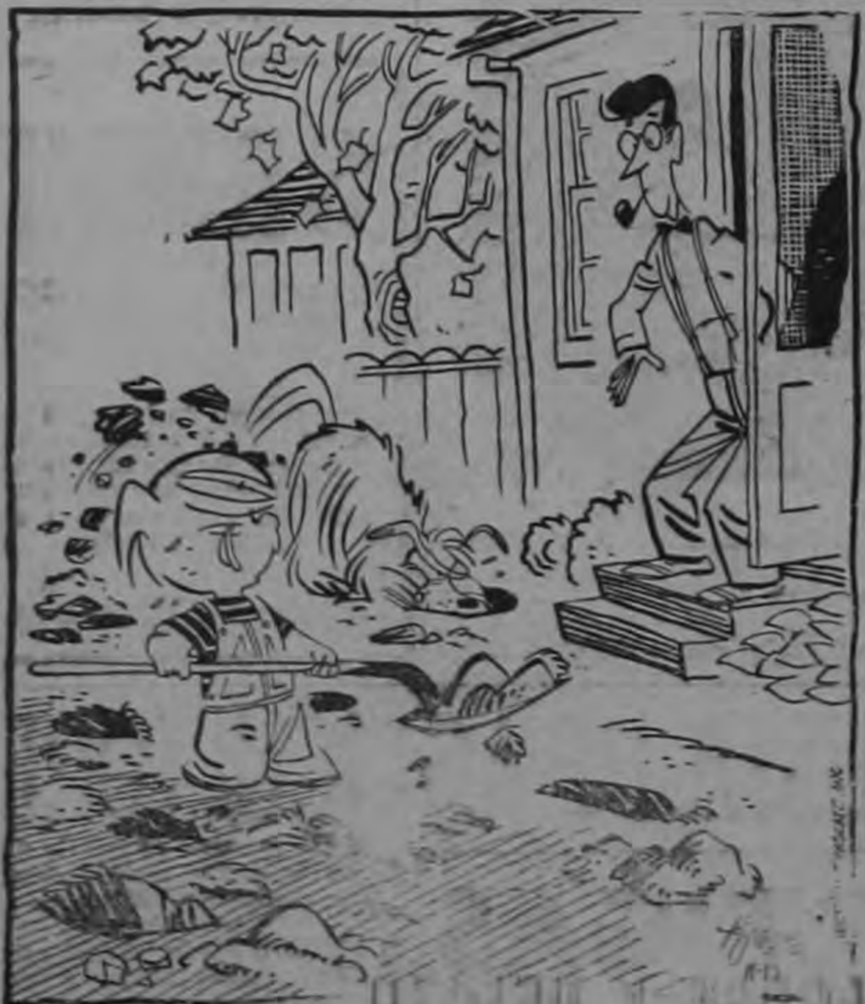
—Yo estoy buscando un tesoro... Lo que busca Rufo, eso no lo sé.