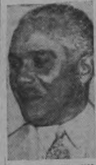
Rafael L. Trujillo Dominican Republic