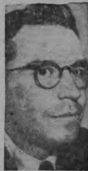
Victor Paz Estenssoro Bolivia ...nacionalizó las minas de estaño y repartió las tierras...

rar. De los cuatro países presuntamente democráticos sólo quedan ahora dos. n golpe de estado en Cuba y una agresión extranjera en Guatemala les han arrebatado la libertad. Y con todo este tiempo la única victoria limpia de la democracia en América ha sido la de José Figueres en Costa Rica.