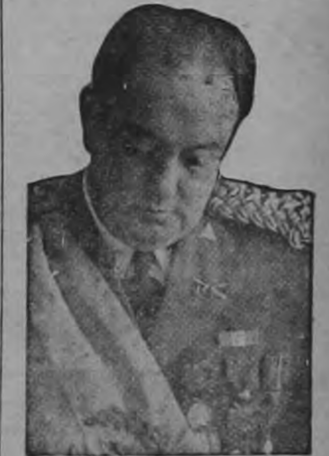
ANASTASIO SOMOZA ...ha hecho de Nicaragua una hacienda particular...