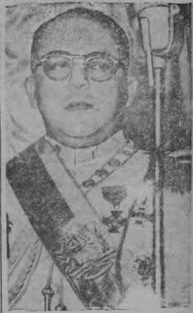
MARCOS PEREZ JIMENEZ ...Los espadones se instalaron otra vez en el Palacio de Miraflores...

ranterie sus fueros. Al gran capitalista de las grandes mayorías nacionales, le molesta un estado de derecho donde esas mayorías decidan libremente. Y el gran capital busca al dictador par que le seguere sus privilegios. Al imperialismo económico ejercido por países extranjeros resulta incómodo un gobierno que cuide la riqueza doméstica con sentido nacionalista. Y el imperialismo económico apoya al dictador que le mantenga sus ventajosas condiciones de explotación.