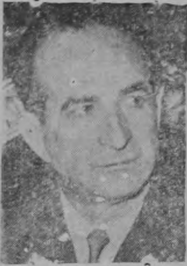
JOSE FIGUERES ...la única victoria limpia de la democracia...